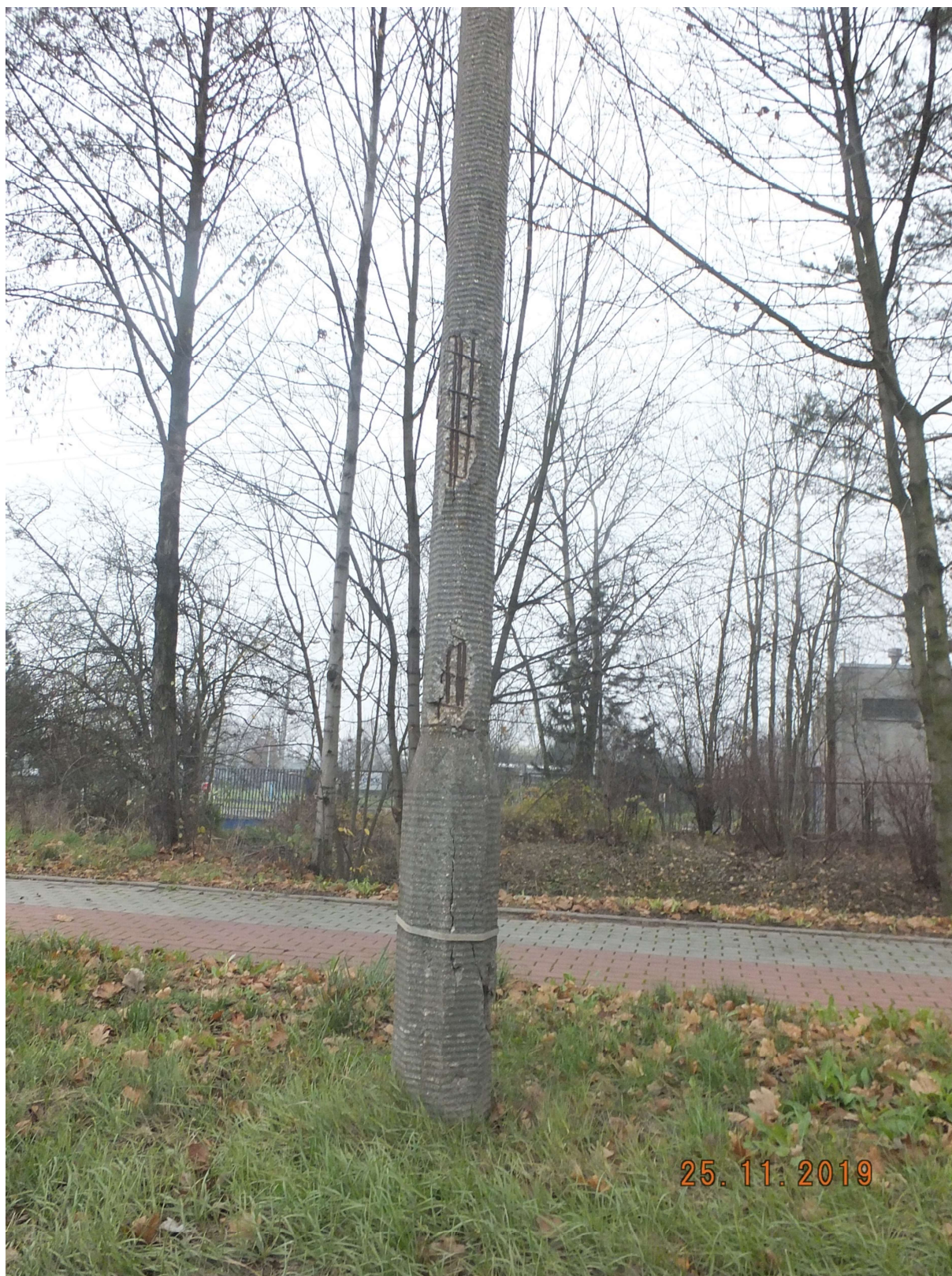
RYСУNEK 1 SŁUP ŻELBETOWY PRZY ULICY ŚWIERCZYŃSKIEJ